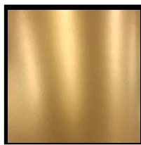
UV-H 특금색 적색계

[폐사독자적인 금속분에 대한 표면처리기술(특허취득)에 의하여 장기보관안정성이 특징으로 겔화문제를 클리어하고 있습니다.]