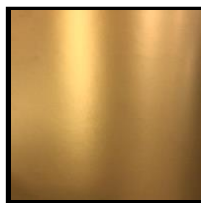
UV-L 특금분색 적색계