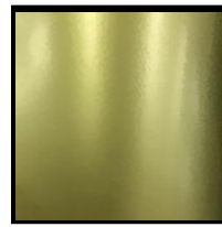
UV-H 특금색 청색계